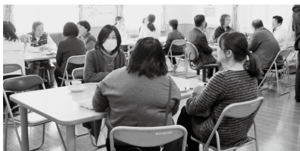
▲家族の方の相談風景

認知症の症状がある方、そのご家族が楽しめる、話ができる場所の企画を今後も予定しております。