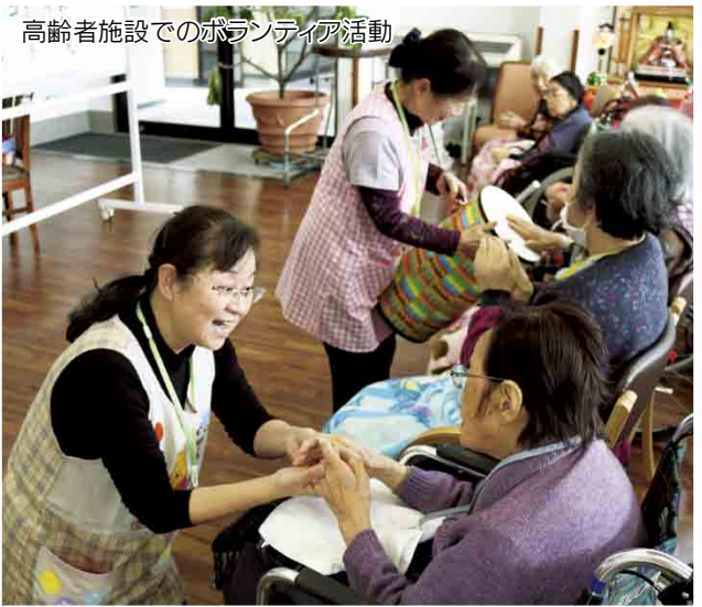
高齢者施設でのボランティア活動