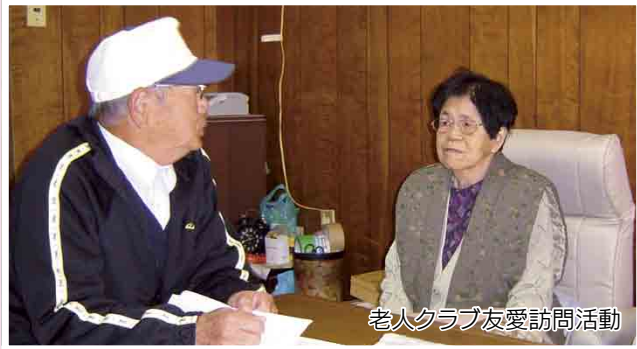
老人クラブ友愛訪問活動