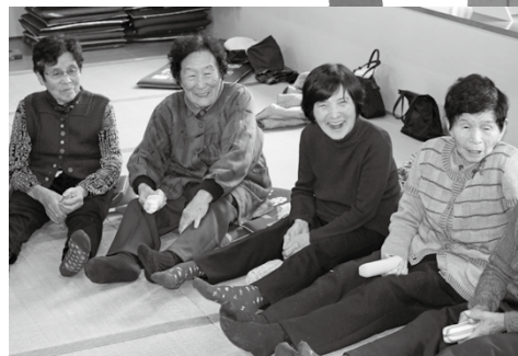
▲野場いきいきサロンの様子