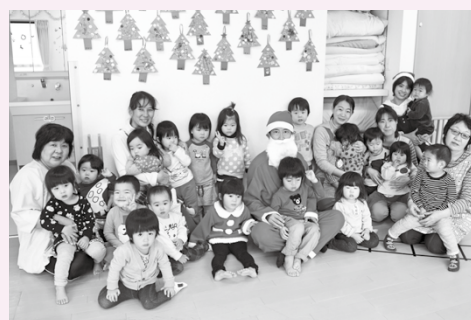
▲リトルラビット保育園で行われたクリスマス会の様子

皆さまからご協力いただきました歳末たすけあい募金で、町内保育施設13施設への活動助成を行いました。それぞれの園ではクリスマス会などが行われ、楽しそうな園児の笑顔が広がりました。