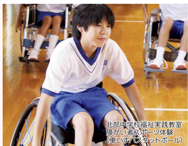
北部中学校福祉実践教室 障がい者スポーツ体験 (車いすバスケットボール)