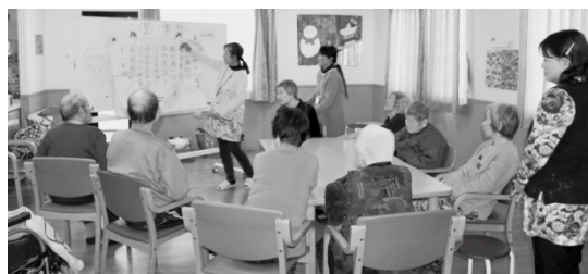
▲回想法を参加者と楽しみました

参加者の方からは、「家族が認知症かもしれないと不安に思っていた。介護経験のある方に経験談を話してもらえて良かった。」との声がありました。