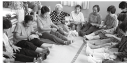
リズムに合わせて隣のお膝をポン！と叩きながら瞬発力を養っております。

最高齢で93歳の参加者は、「歩いて30分かけてここに来るが全く苦にならない。そのくらい、サロンに来るのが楽しみではない。」と話されました。サロン内には笑い声があふれ、温かい雰囲気にも包まれていました。