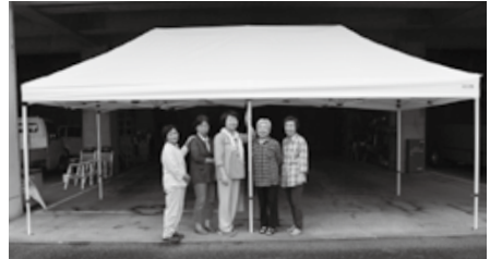
収集ボランティア“はあとふる”のみなさんと寄付していただいたテント (テントサイズ3m×6m)