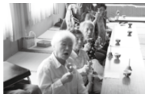
ハンドベルで「ふるさと」を演奏中です。