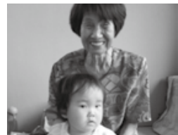
今日はひ孫さんとサロンに参加中です。