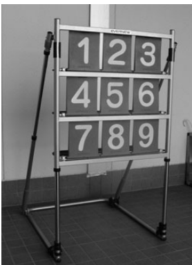
ストライクボードが 仲間入りしました。

社会福祉協議会では、さまざまな物品の貸出事業を行っています。子ども会などの地域行事でご利用ください。