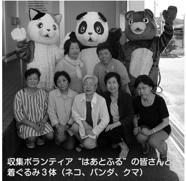
収集ボランティア“はあとふる”の皆さんと 着ぐるみ3体（ネコ、パンダ、クマ）